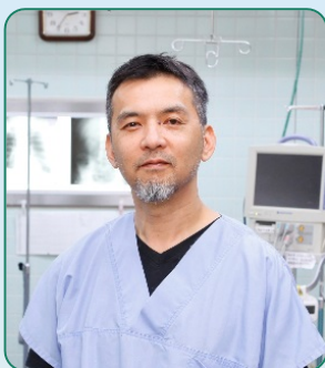
医療法人一誠会 川崎胃腸科肛門科病院 みと肛門クリニック

に大きな影響を与えます。今回の講演が皆さまの健康で充実した毎日の参考になれば幸いです。